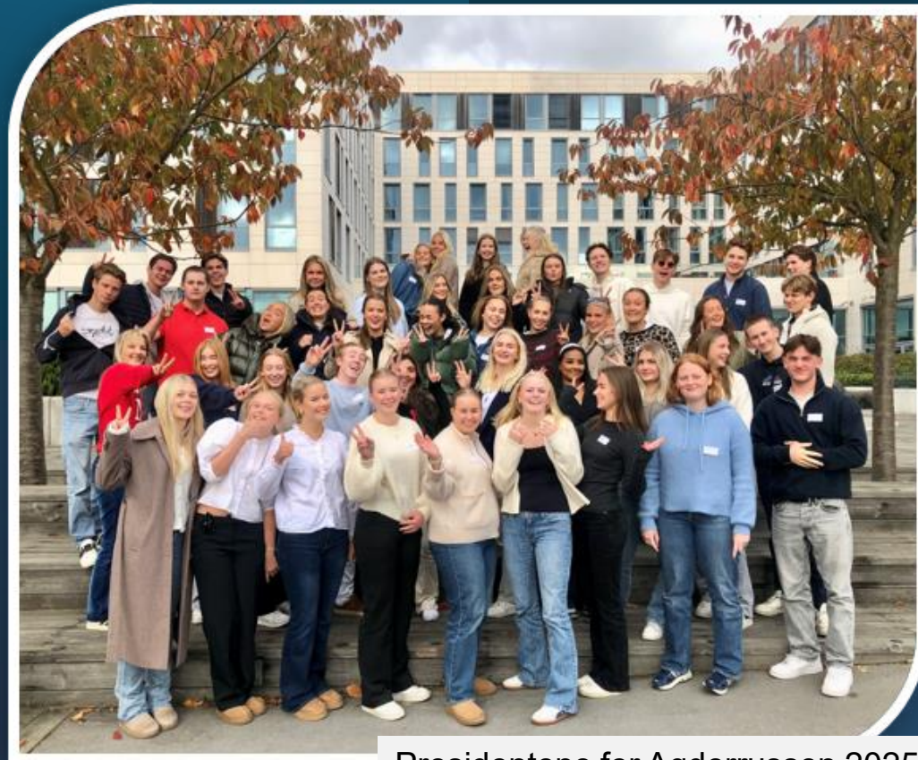
Presidentene for Agderrussen 2025

Gode valg – egne valg. Om å være seg selv og samtidig høre til