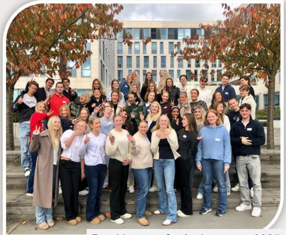
Presidentene for Agderrussen 2025

Samarbeid med de som vil dere vel, ikke de som tjener penger på dere.