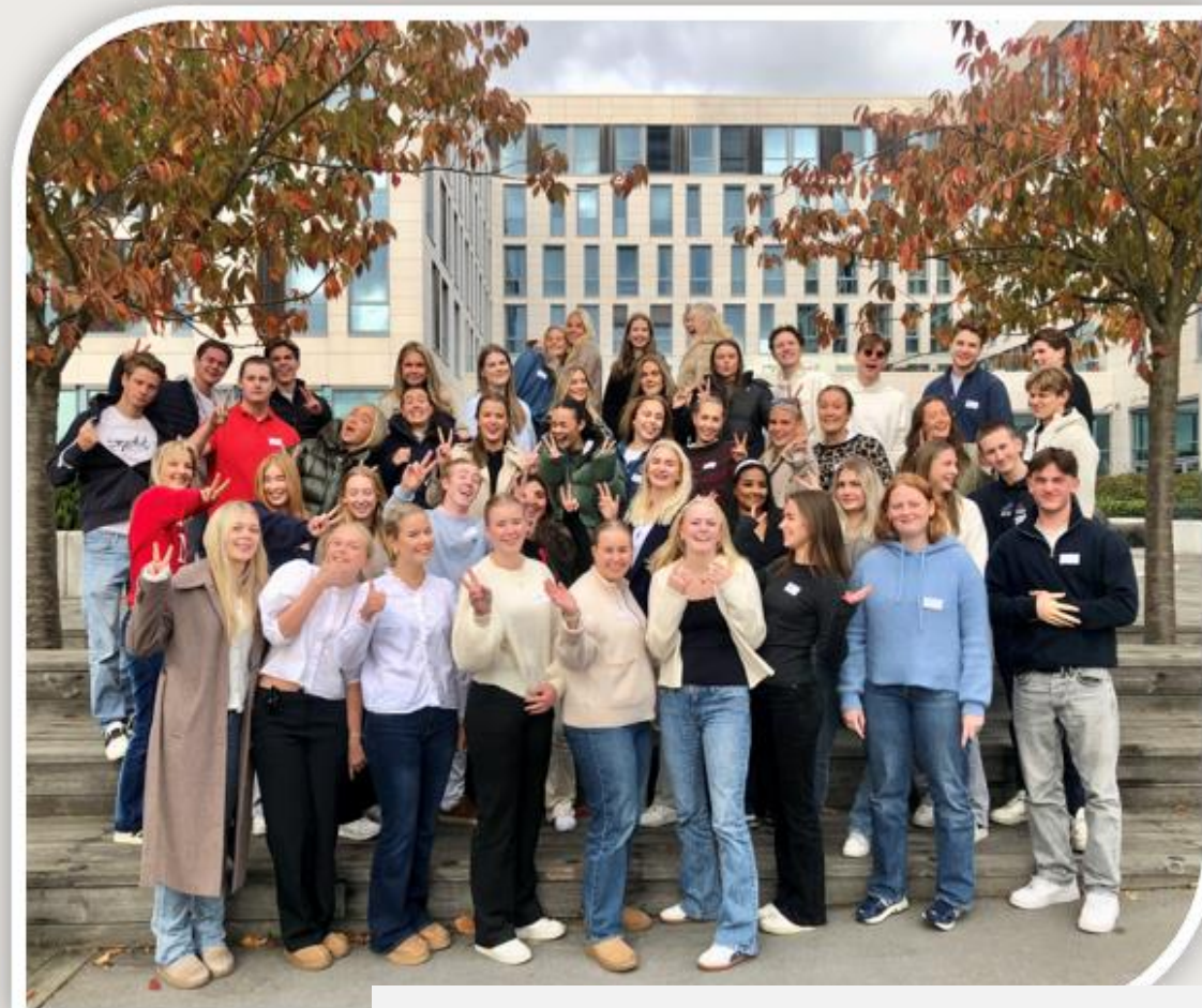
Presidentene for Agderrussen 2025

Smart? Når er det bra, og når er det ikke bra?